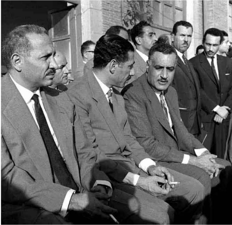
عبد الناصر في ميدان الجمهورية عقب الانفصال ١٩٦١/٩/٢٨